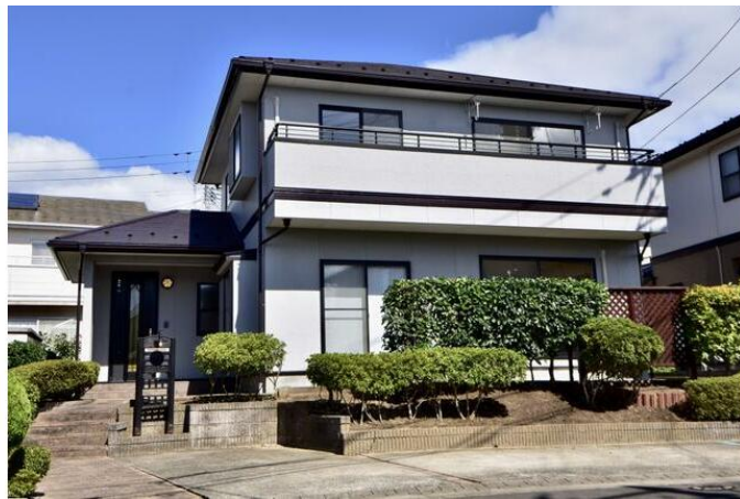
南面道路で陽当たり良好♪駐車スペースはL型2台♪

販売物件は、厳正な物件調査を行い、良質な物件のみを自社で購入して、リノベーションを行なっています。