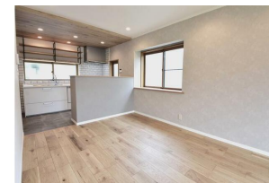
キッチンエリアの天井には木目調のアクセント♪